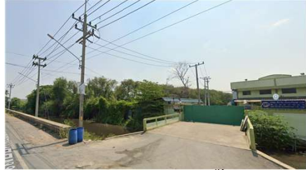
(หัวเสา DDE วงจรบน) DIS.ชั่วคราว

ตั้งแต่ สี่แยกโรงเรียนบ้านแครายเกษตรพันธุ์พิทยาคาร จนถึง หน้า บริษัท เซ็ยะ จี้อ เอ็นเตอร์ไพรส์ จำกัด เพื่อให้ชุดงาน ผกส.กฟส.กทบ. ปฏิบัติงาน ปักเสาไฟ คอร. หน้าพื้นที่ก่อสร้าง สฟฟ.กระทุ่มแบน 6 วันที่ปฏิบัติงาน คือ วันอาทิตย์ที่ 14 ก.ค. 2567 เวลา 8.30 - 17.00 น.